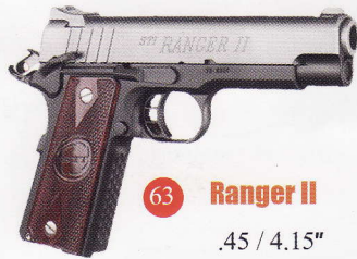
63 Ranger II