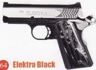
64 Elektra Black