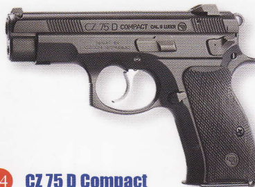
CZ 75 D Compact