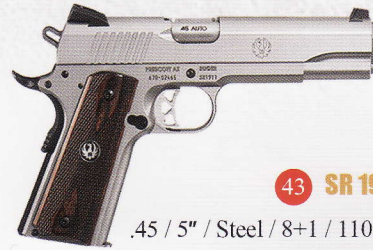
43 SR 1911