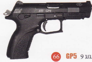
66 GP5 9 มม.