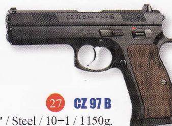
CZ 97 B