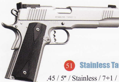
51 Stainless Target II