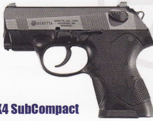
59 PX4 SubCompact