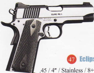
47 Eclipse Pro II