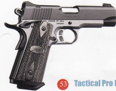
53 Tactical Pro II