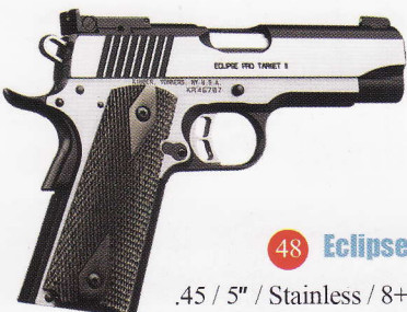
48 Eclipse Target II