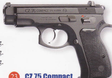
CZ 75 Compact