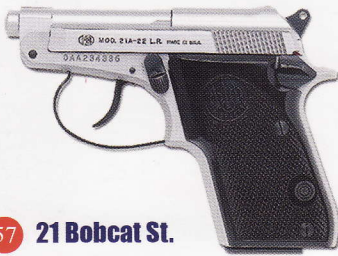
57 21 Bobcat St.