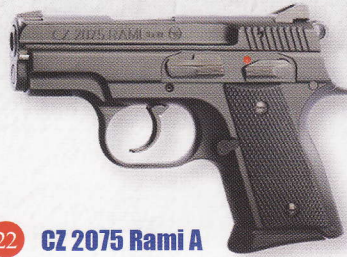
CZ 2075 Rami A