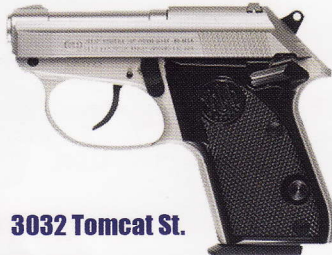
58 3032 Tomcat St.