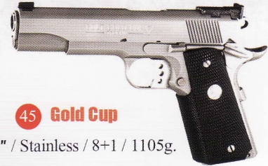
45 Gold Cup

.45 / 3" / Alloy-Stainless / 7+1 / 637g.