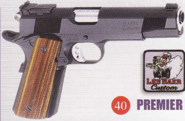
40 PREMIER II