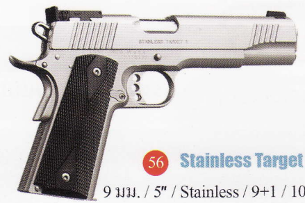
56 Stainless Target II