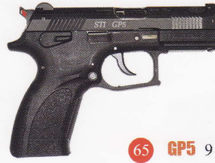
65 GP5 9 มม.