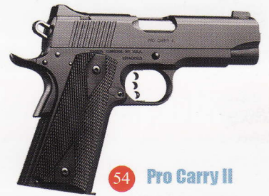
54 Pro Carry II