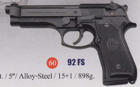
60 92 FS