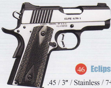
46 Eclipse Ultra II