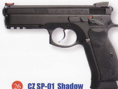
CZ SP-01 Shadow